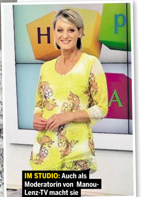
IM STUDIO: Auch als Moderatorin von Manou-Lenz-TV macht sie eine gute Figur.